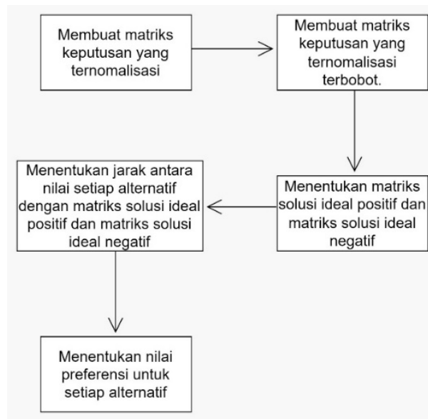
Gambar 2. Langkah – langkah metode TOPSIS