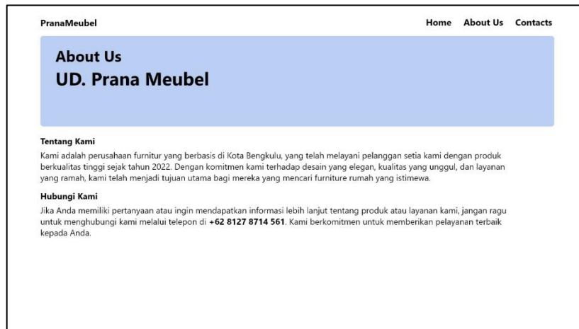
Gambar 3. Halaman About Us Website Katalog Produk Prana Meubel

Pada halaman ini calon pembeli dapat melihat lebih detail tentang produk yang ditampilkan yaitu berupa kondisi, bahan, warna, estimasi pembuatan, serta ongkos kirim barang tersebut.