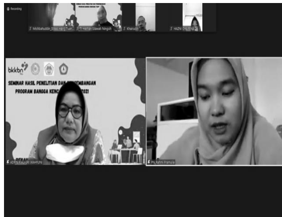
Gambar 2. Laporan Tentang Hasilkegiatan Yang Telah Dilakukan

Adapun hasil data yang diperoleh selama dilakukan pendataan :