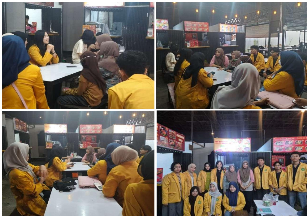
Gambar 2. Pelaksanaan Kegiatan

Selanjutnya, dilakukan pelatihan penggunaan buku kas sederhana yang dirancang sesuai dengan kebutuhan UMKM. Pelatihan ini mencakup cara mencatat pemasukan dari penjualan, pengeluaran untuk pembelian bahan baku dan operasional. Serta cara menghitung selisih antara keduanya. Setelah penyampaian materi, mitra diajak untuk melakukan praktik langsung dengan mencatat transaksi harian berdasarkan kondisi riil usaha. Tim pengabdian juga memberikan contoh format pencatatan yang mudah digunakan dan dapat diterapkan secara berkelanjutan. Selama kegiatan berlangsung, dilakukan diskusi interaktif untuk mengidentifikasi kendala yang dihadapi mitra dalam pengelolaan keuangan.