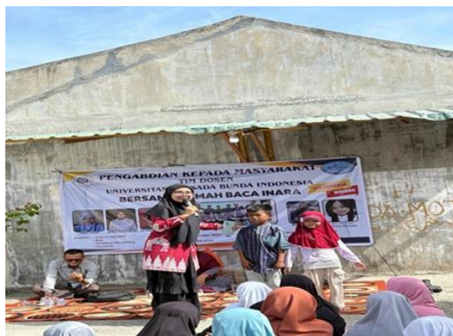
Gambar 3. Simulasi dan Role Play Komunikasi

Peserta dibagi dalam beberapa kelompok untuk mendiskusikan materi yang telah diberikan