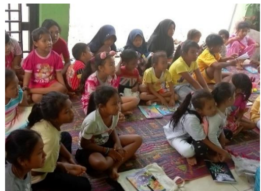
Gambar 4. Praktik Menulis

Kegiatan simulasi dilakukan untuk melatih keterampilan komunikasi interpersonal peserta.