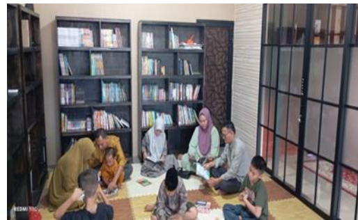
Gambar 2. Diskusi Kelompok

Kegiatan penyampaian materi tentang pentingnya literasi membaca di era digital