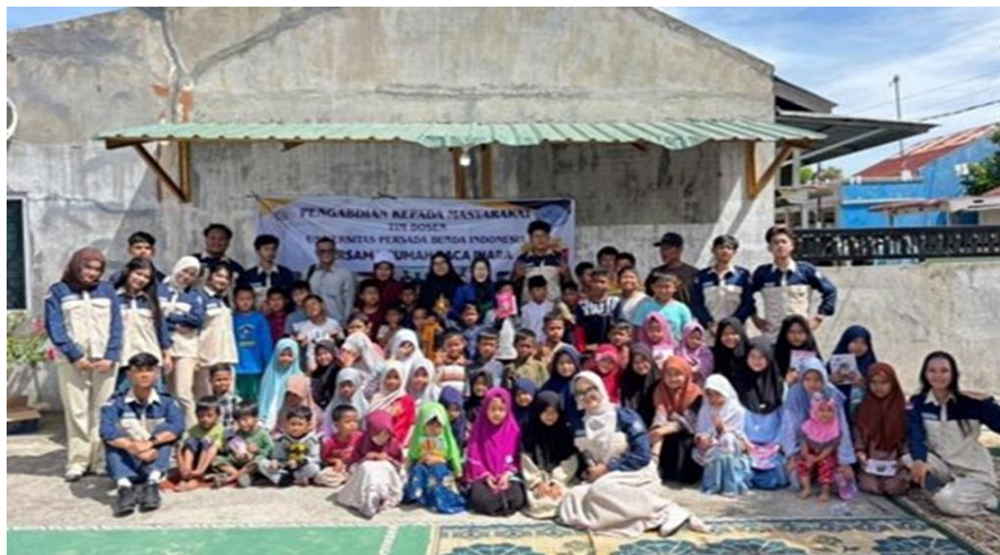
Gambar 6: Foto Bersama

Secara keseluruhan, diagram ini menunjukkan bahwa kegiatan PkM memberikan dampak positif yang merata pada seluruh aspek yang diukur. Peningkatan terbesar pada aspek kepercayaan diri dan komunikasi lisan mengindikasikan bahwa metode pembelajaran berbasis praktik dan partisipatif sangat efektif dalam meningkatkan keterampilan komunikasi interpersonal.