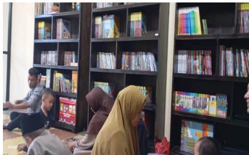
Gambar 1. Penyuluhan Literasi Membaca

Kegiatan penyampaian materi tentang pentingnya literasi membaca di era digital