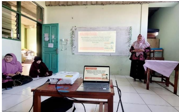
Gambar 4. Pemaparan Materi Investasi