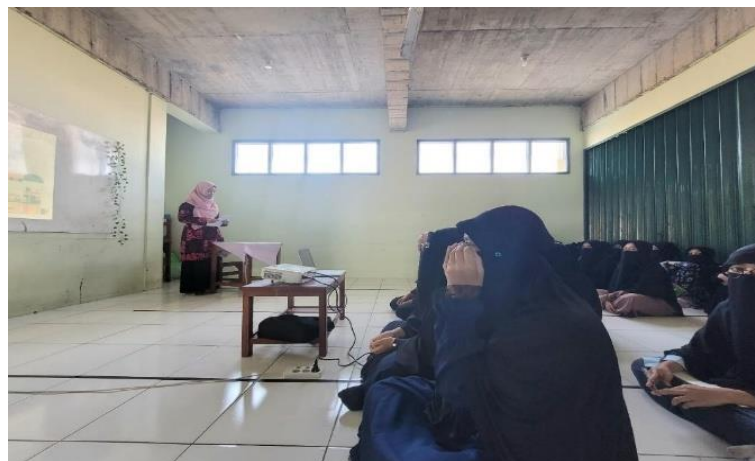
Gambar 3. Pemaparan Materi Wirausaha

Selain dampak pada individu, program ini juga memperkuat kolaborasi antara perguruan tinggi dan pesantren sebagai bentuk implementasi Tri Dharma Perguruan Tinggi. Pesantren memperoleh manfaat berupa peningkatan kapasitas edukasi ekonomi, sedangkan perguruan tinggi memperoleh ruang praktik pengabdian yang relevan.