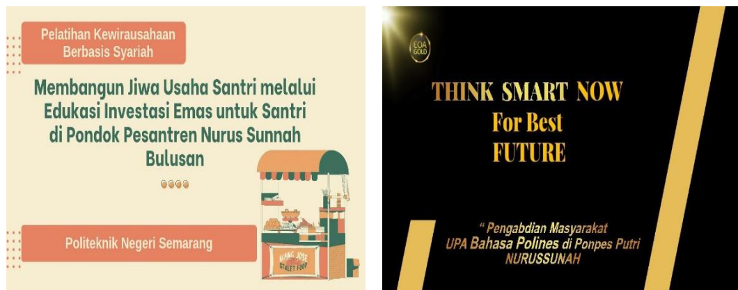
Gambar 2. Materi Pelatihan

Materi dirancang dengan pendekatan kontekstual berbasis masalah nyata yang dialami santri, seperti kebutuhan mengatur uang saku, menabung, atau mempersiapkan masa depan.