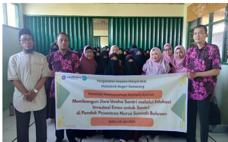
Gambar 6. Bersama Pengurus Yayasan dan Pondok Pesantren Nurussunnah\