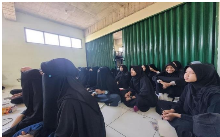
Gambar 5. Santriwati Antusias Mengikuti Pelatihan