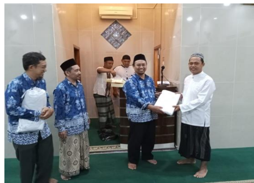
Gambar 6: Penyerahan simbolik pada Ketua Jana'iz

Dari antusiasme jama'ah dan kesungguhan mereka berlatih mengkafankan jenazah, dimana satu orang dari tim berperan menjadi jenazahnya, sehingga ketika jama'ah mempraktekkan sendiri mengkafani, mereka bisa merasakan seberapa kuat ikatan yang telah tim ajarkan. Merekapun bisa melihat hasil praktek sendiri ketika mengkafani, apakah cara membungkusnya sudah rapih atau belum. Ketika mendapati cara membungkusnya kurang rapih, mereka pun tak segan mengulangnya lagi langkah awal mengkafani.