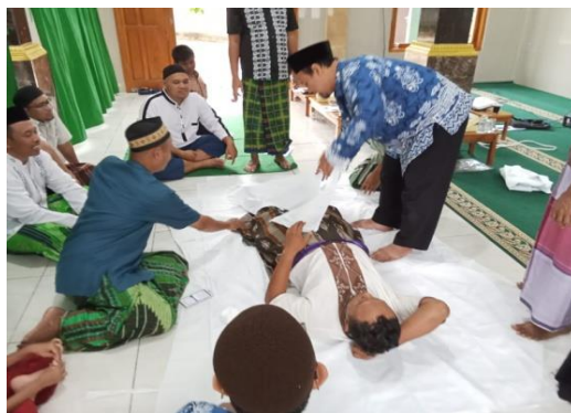
Gambar 5: Praktek Mengkafani

Pelaksanaan pelatihan kepada masyarakat peserta pelatihan dengan menggunakan cara presentasi; yaitu mempresentasikan slide ppt yang sudah disiapkan oleh tim pengabdian tentang mengkafani jenazah yang ditutup dengan menonton beberapa video ragam variasi dalam mengkafani jenazah, baik itu untuk jenazah laki-laki atau juga untuk jenazah perempuan. Selanjutnya tanya jawab pada akhir penyampaian slide ppt . Dalam setiap penyampaian oleh tim abdimas, ada beberapa jama'ah yang bertanya, seperti pertanyaan dari bapak Yoga ketika tim abdimas pertama mempresentasikan materi, "Apakah semua alat itu harus lengkap, bagaimana jika tidak ada bubuk bidara?" Hal tersebutpun terulang pada presentasi yang kedua, dimana pak Feri bertanya, "Bolehkan jika jenazah dibungkus dengan kain ihram yang pernah dipakai berhaji?." Demikian pula pada saat melakukan praktek mengkafani jenazah, banyak pertanyaan interaktif terjadi didalamnya, seperti pak Dwi yang bertanya, "Kenapa ikatan tali kain kafan itu dominan ditaru dibagian kanan jenazah, bukan ditengah seperti pada umumnya?" oleh jama'ah Musholla Al Jihad di Perumahan Grand Mulia (GMK) Kalisuren, Tajurhalang, Bogor.