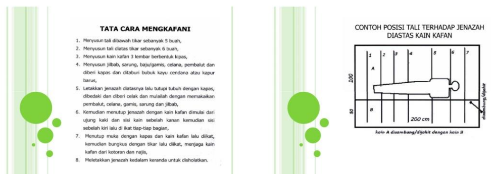
Gambar 2: Contoh Modul