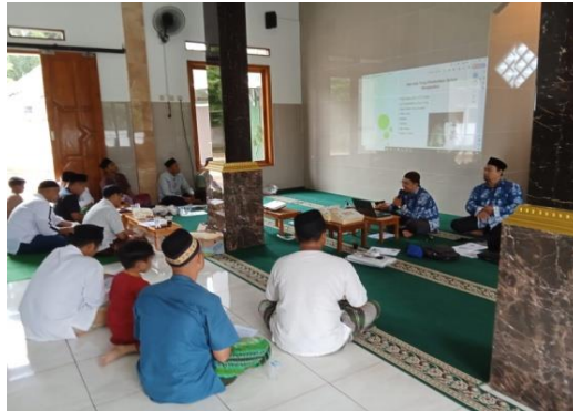
Gambar 3: Penyampaian Materi