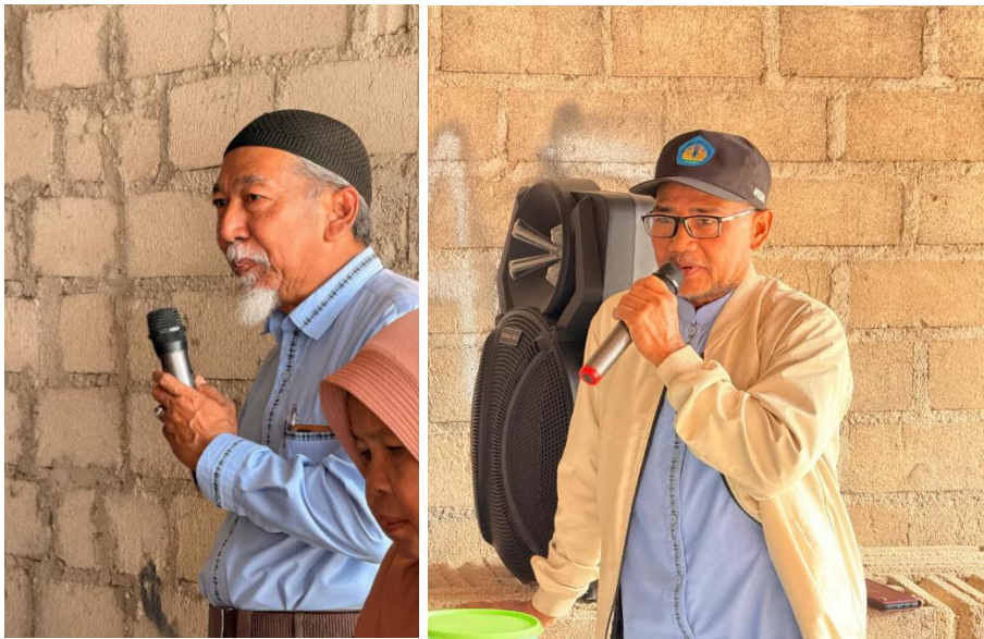
Gambar 1. Penyampaian Materi Oleh Tim Pengabdian

Kegiatan pengabdian kepada masyarakat mengenai pemanfaatan limbah minyak jelantah di Desa Jatibaru 2, Kecamatan Tanjungbintang, diikuti oleh sekitar 30 peserta yang terdiri atas ibu rumah tangga dan remaja putri. Pelaksanaan kegiatan dilakukan melalui dua tahapan utama, yaitu penyampaian materi (penyuluhan) terkait dampak minyak jelantah oleh tim pengabdian, serta pelatihan praktik pengolahan minyak jelantah menjadi produk yang memiliki nilai guna. Pada tahap penyuluhan, tim pelaksana memberikan edukasi mengenai risiko penggunaan minyak goreng secara berulang yang dapat menghasilkan senyawa berbahaya yang bersifat karsinogenik. Selain itu, disampaikan pula dampak lingkungan dari pembuangan minyak jelantah secara tidak tepat yang dapat mencemari tanah dan air. Peserta juga diperkenalkan pada potensi pemanfaatan minyak jelantah sebagai bahan baku alternatif untuk berbagai produk bernilai ekonomi seperti sabun batangan (Gambar 1.)