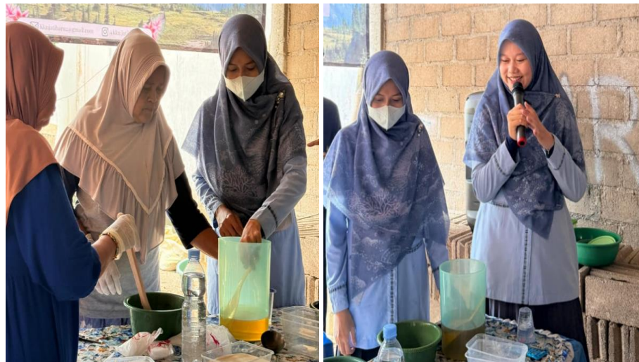
Gambar 2. Praktik Pembuatan Sabun Batang Dari Minyak Jelantah