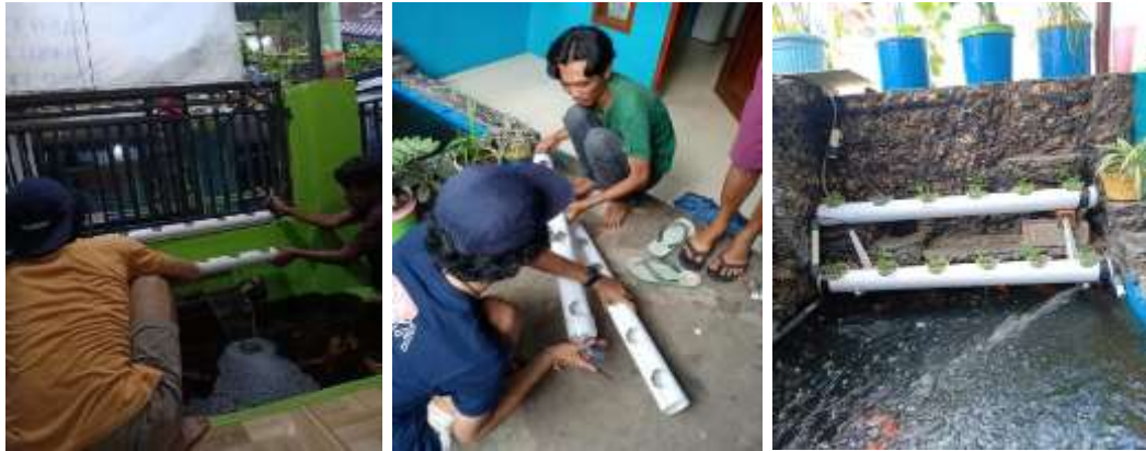
Gambar 6. Merupakan Hasil Dokumentasi Instalasi Perangkat Hidroponik.

Selain melaksanakan program kerja pengabdian kepada masyarakat, tim PKM juga berbaaur dan berkolaborasi dengan warga melalui kegiatan pengajian rutin yang dilaksanakan di Mushola RT 03/RW 03. Kegiatan majelis taklim tersebut dilaksanakan setiap Minggu Malam dengan membaca surat Yasin, dzikir dan ceramah yang bertujuan untuk meningkatkan ilmu, keimanan dan akhlak mulia, mempererat silaturahmi, membentuk karakter islami, serta wadah pemberdayaan diri dan masyarakat yang mencakup pengembangan ekonomi umat dan pemecahan masalah keagamaan. Gambar 7 merupakan rangkuman hasil kegiatan pengajian rutin bersama warga di lingkungan RT 03/RW 03 kelurahan Cilembang.