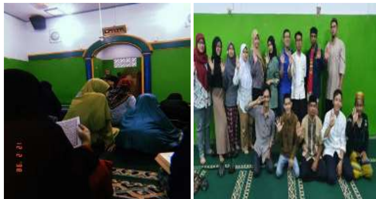
Gambar 7. Pengajian Rutin bersama warga

Selain melaksanakan program kerja pengabdian kepada masyarakat, tim PKM juga berbaaur dan berkolaborasi dengan warga melalui kegiatan pengajian rutin yang dilaksanakan di Mushola RT 03/RW 03. Kegiatan majelis taklim tersebut dilaksanakan setiap Minggu Malam dengan membaca surat Yasin, dzikir dan ceramah yang bertujuan untuk meningkatkan ilmu, keimanan dan akhlak mulia, mempererat silaturahmi, membentuk karakter islami, serta wadah pemberdayaan diri dan masyarakat yang mencakup pengembangan ekonomi umat dan pemecahan masalah keagamaan. Gambar 7 merupakan rangkuman hasil kegiatan pengajian rutin bersama warga di lingkungan RT 03/RW 03 kelurahan Cilembang.