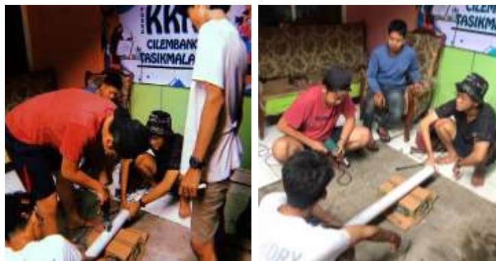
Gambar 5. Proses Pembuatan Hidroponik

Gambar 4 merupakan rangkuman dokumentasi penyebaran bibit tanaman pada pot-pot tanaman dalam program vertical garden . Pada gambar tersebut terlihat tim PKM sedang menyiapkan pot dan media tanam, serta menanam benih tanaman ke dalam pot-pot secara bersama-sama.