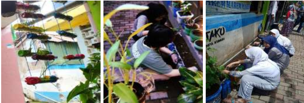
Gambar 4. Proses Penanaman Bibit

Gambar 3 merupakan rangkuman dokumentasi proses daur ulang sampah botol minuman bekas. Dalam kegiatan tersebut, tim PKM mengumpulkan botol minuman bekas dengan cara memilah sampah non-organic yang ada di lingkungan RT 03/RW 03. Selanjutnya botol bekas tersebut dibersihkan dan dicat / dihias agar terlihat menarik, kemudian diisi pupuk organik dan digunakan sebagai pot tanaman untuk kegiatan vertical garden .