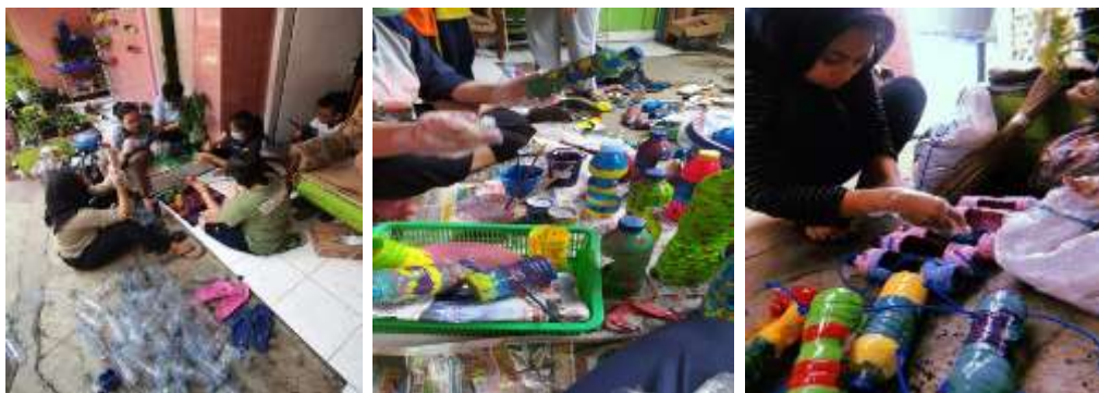
Gambar 3. Proses Daur Ulang Sampah Botol Minuman Bekas

Selanjutnya tim PKM melaksanakan kegiatan daur ulang sampah di salah satu rumah warga yang dijadikan sebagai base camp . Kegiatan ini diawali dengan mengumpulkan sampah non-organik, seperti : botol minuman bekas dan sejenisnya.