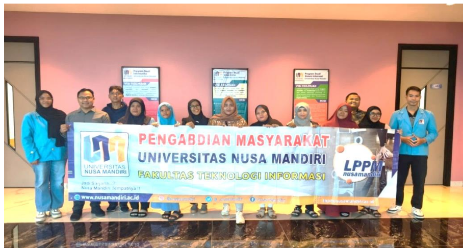
Gambar 4. Foto Bersama