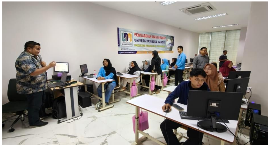
Gambar 3. Peserta Melakukan Interaksi Tanya Jawab