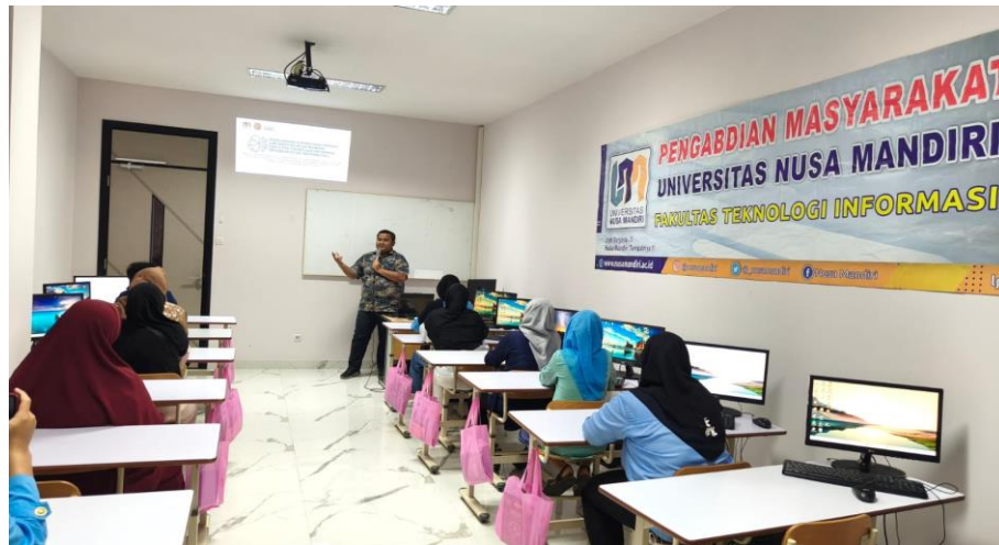
Gambar 1. Penyampaian materi oleh Tutor

Tutor menjelaskan workshop pelatihan dengan penjelasan mengenai penggunaan Google AI Studio menyediakan beberapa antarmuka untuk perintah yang dirancang untuk kasus penggunaan yang berbeda. Panduan ini membahas Perintah chat, yang digunakan untuk membuat pengalaman percakapan. Teknik perintah ini memungkinkan beberapa input dan respons bergantian untuk menghasilkan output. Selanjutnya bentuk konten afiliasi dimulai dengan pencarian informasi mengenai produk lengkap dengan gambar asli produk kemudian peserta mencari kegunaan dari produk tersebut dan membuat prompt seperti tampak pada Gambar 2: