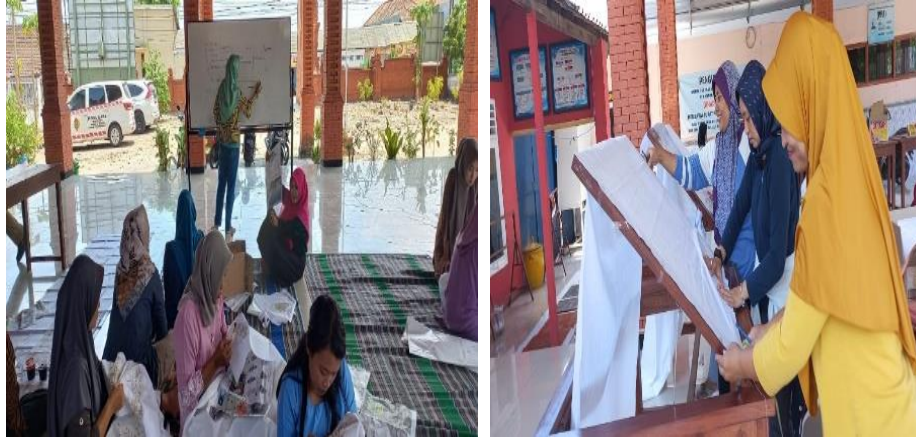
Gambar 3. Tim Pengabdian Melatih Masyarakat Desa Puloniti

menambah pendapatan ekonomi keluarga yang berada di Desa Puloniti. Berikut merupakan implementasi keterampilan membuat batik guna meningkatkan pendapatan ekonomi keluarga Desa Puloniti.