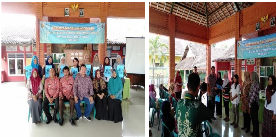
Gambar 2. Tim Pengabdian dan Peserta Sosialisasi Batik di Balai Desa Puloniti.

Dalam batik Nitis yang berada Di Desa Puloniti memiliki arti agar birokrasi Desa Puloniti memiliki sebuah sasaran, Adapun sasarannya adalah membawa kesejahteraan bagi seluruh masyarakat yang berada di Desa Puloniti, serta dalam membangun sebuah kebijakan sesuai apa yang dibutuhkan oleh masyarakat Desa Puloniti. Tepat sasaran juga harus memperhatikan tindakan seseorang dengan sadar dan pertimbangan yang terkait dengan tujuan serta ketersediaan alat yang digunakan dalam mencapai sebuah sasaran atau tujuan (Kiraya Azharani & Nanang, 2023). Kegiatan sosialisasi batik di balai desa Puloniti ditunjukkan pada gambar 2.