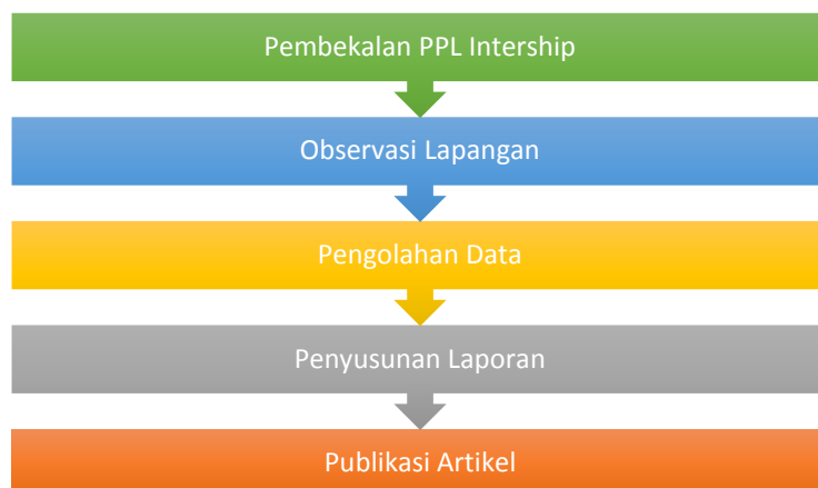
Gambar 2. Desain Kegiatan PPL