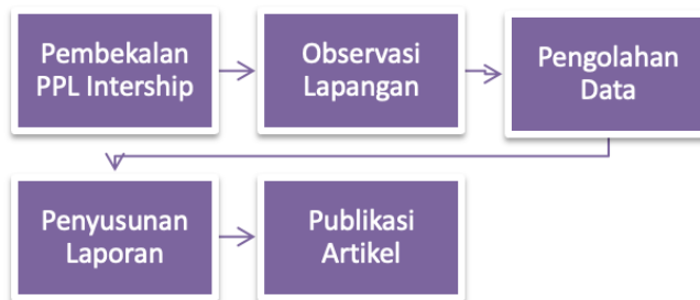
Gambar 2. Desain Kegiatan PPL