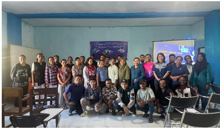
Gambar 2. Sesi Foto Bersama Peserta Sosialisasi

Dokumentasi pelaksanaan kegiatan PKM antara angkatan muda gereja Sion Sanggeng-Manokwari dan para dosen STMIK Kreatindo Manokwari adalah sebagai berikut: