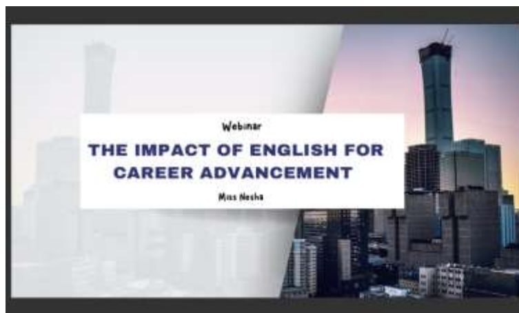
Gambar 2. Slide Power Point Oleh Narasumber

Dengan adanya sesi penyampaian materi dan tanya jawab bersama peserta kegiatan, para peserta yang mengikuti kegiatan ini diharapkan mampu memiliki motivasi dan gambaran yang kongkrit terkait penggunaan Bahasa Inggris untuk menunjang karir kedepannya.