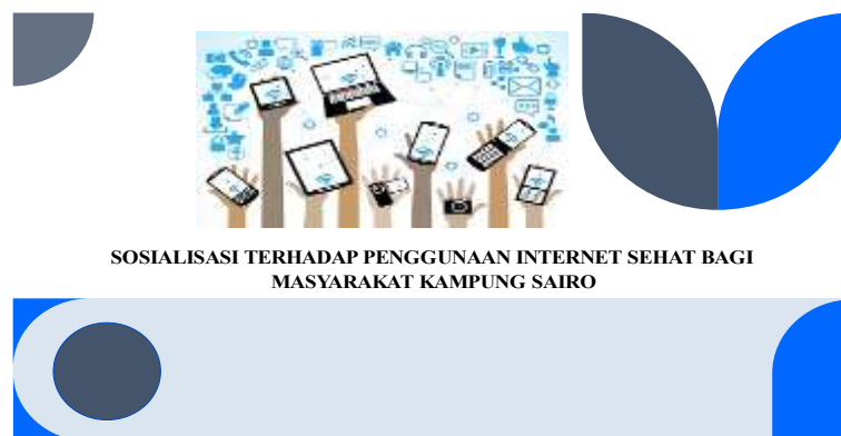
Gambar 3. Slide Materi Sosialisasi

Pada gambar 3 dibawah ini menunjukkan tampilan slide yang digunakan pada kegiatan sosialisasi untuk penyampaian materi internet sehat.