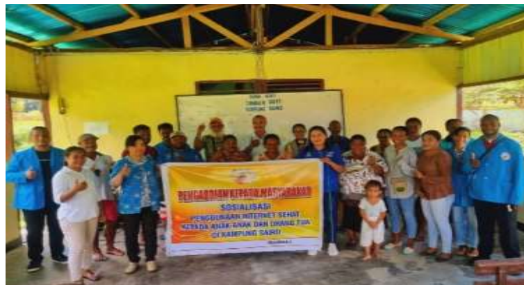
Gambar 2. Foto Bersama Peserta

Gambar dibawah ini merupakan dokumentasi kegiatan sosialisasi bersama masyarakat kampung Sairo.