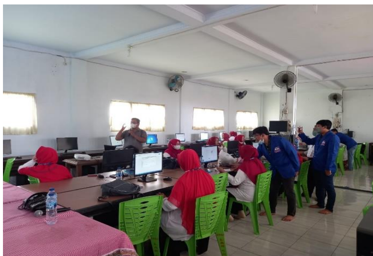
Gambar 2. Praktik Penggunaan Canva

Bagian integral dari pelatihan ini adalah sesi praktek langsung menggunakan Canva untuk membuat materi pembelajaran. Para guru akan diberikan kesempatan untuk mencoba langsung berbagai fitur dan alat yang disediakan oleh Canva, serta mendapatkan umpan balik langsung dari instruktur dan sesama peserta.