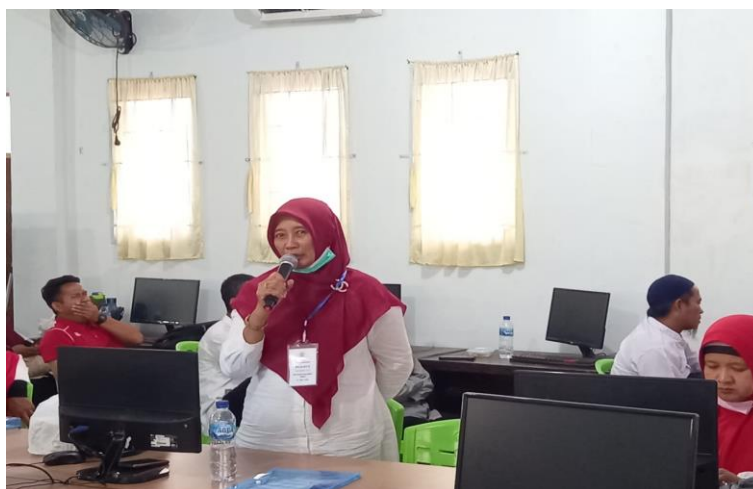
Gambar 3. Kegiatan Tanya Jawab