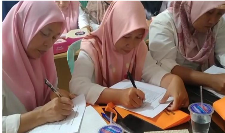
Gambar 6. Pengisian Post-Test Pelatihan Posyandu Prima

Setelah melakukan pelatihan dan mempraktikkan secara langsung pengukuran posyandu prima, para peserta melaksanakan post-test untuk mengetahui dan mengevaluasi apakah materi pelatihan yang telah dipaparkan dan dikuasai oleh para kader posyandu sehingga dapat diterapkan posyandu prima.