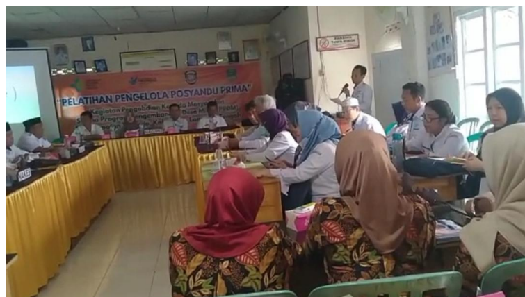
Gambar 3. Sosialisasi Posyandu Prima

Sosialisasi kegiatan posyandu prima di adakan di Balai Kampung Pujo Kerto pada tanggal 17 Maret 2023 yang dilaksanakan di Balai Kampung Pujo Kerto. Nara sumber dari Dinas Kesehatan