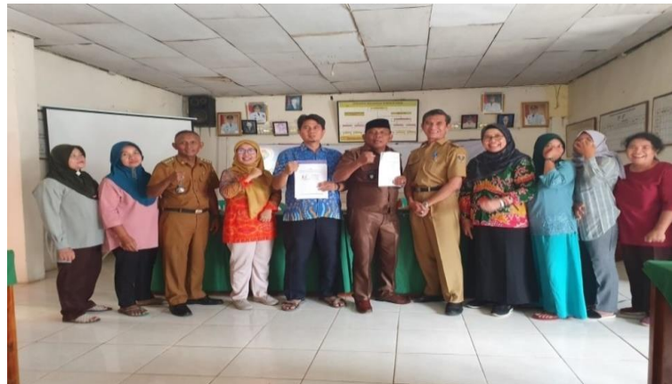
Gambar 2. Penandatanganan Kerjasama dan Pembentukan Organisasi Posyandu Prima di Kampung PujoKerto