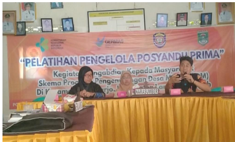
Gambar 4. Pelatihan Posyandu Prima

Kegiatan Pelatihan Posyandu Prima diadakan bersamaan dengan Sosialisasi kegiatan posyandu prima di adakan di Balai Kampung Pujo Kerto pada tanggal 17 Maret 2023 yang dilaksanakan di Balai Kampung Pujo Kerto. Nara sumber dari Dinas Kesehatan Kabupaten Lampung Tengah, Dinas Pemberdayaan Masyarakat Desa, Puskesmas Pujo Kerto dan Akademisi dari Poltekkes Tanjungkarang. Kegiatan ini di ikuti dari berbagai komponen masyarakat, yaitu warga masyarakat, kader posyandu, kader kesehatan aparat kampung dan petugas Puskesmas Pujo Kerto. Jumlah peserta 78 orang peserta.