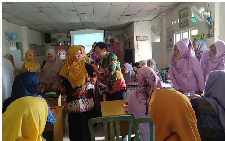
Gambar 5. Praktik Pengukuran Gizi Buruk

Status gizi anak adalah salah satu tolak ukur penilaian tercukupinya kebutuhan asupan gizi oleh tubuh. Jika asupan gizi cukup maka tumbuh kembang anak akan optimal. Status gizi anak di nilai dari : jenis kelamin, umur, tinggi badan, berat badan dan lingkar kepala. (Inamah, dkk 2020)