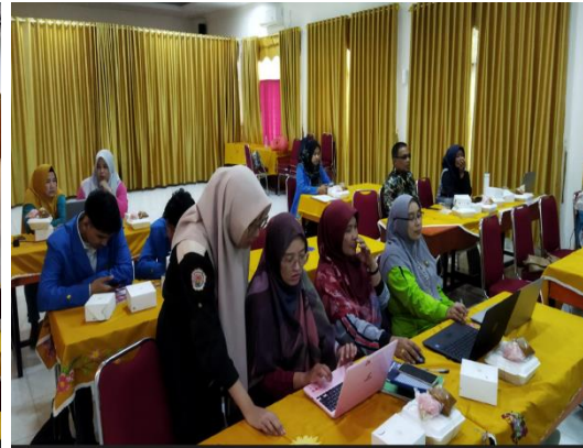
Gambar 3. Pelaksanaan Workshop Dibantu Mahasiswa Prodi SI Untuk Pendampingan Guru-Guru