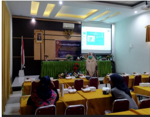
Gambar 2. Proses Persiapan Worskhop

langsung dilaksanakan workshop mulai dari penyiapan materi dicantumkan sampai dengan publish e book ke grup siswa.