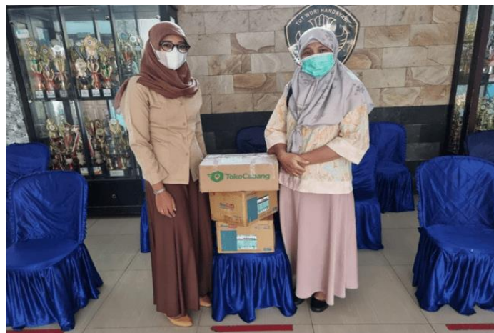
Gambar 4. Penyerahan Sabun Cuci Tangan Dan Hand Sanitizer Ke Perwakilan Sekolah.

Pada akhir kegiatan, diberikan penunjang untuk mencegah penularan Covid-19 berupa sabun cuci tangan dan hand sanitizer (Gambar 4).