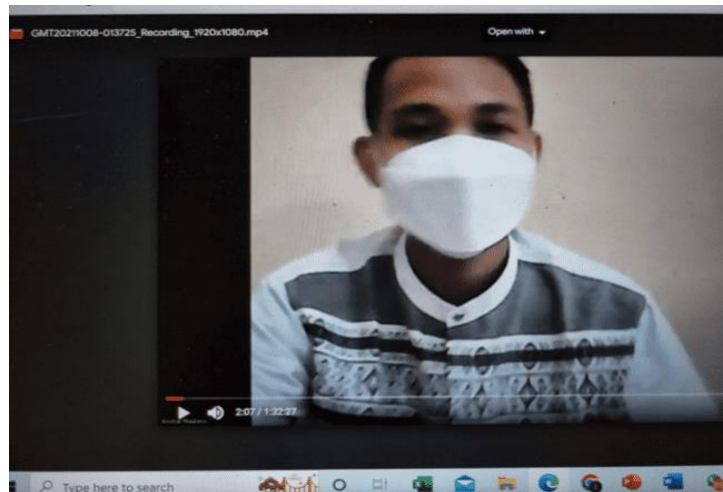
Gambar 1. Pemberian Pengantar Oleh Guru Pembina OSIS SMPIT Almadinah

Kegiatan dilanjutkan dengan pemberian materi terkait Covid-19, vaksin Covid-19, beserta keamanan dan keuntungan mendapatkan vaksin Covid-19 (Gambar 2).