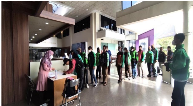
Gambar 2. Antrian Absensi Responden Pengemudi Ojek Online

Peserta yang datang dilakukan pendataan secara tertib dan sesuai protokol kesehatan. Seluruh peserta memakai masker (gambar 2). Gambar 3 memperlihatkan saat sesi ceramah. Peserta mengikuti penyuluhan dengan penuh perhatian tentang gejala, penyebab dan pola hidup terutama pola makan yang dapat memperparah gejala gastritis dan cara pencegahannya. Peserta merasa penyuluhan ini sangat bermanfaat karena baru sekali ini peserta mendapatkan penyuluhan seperti ini.