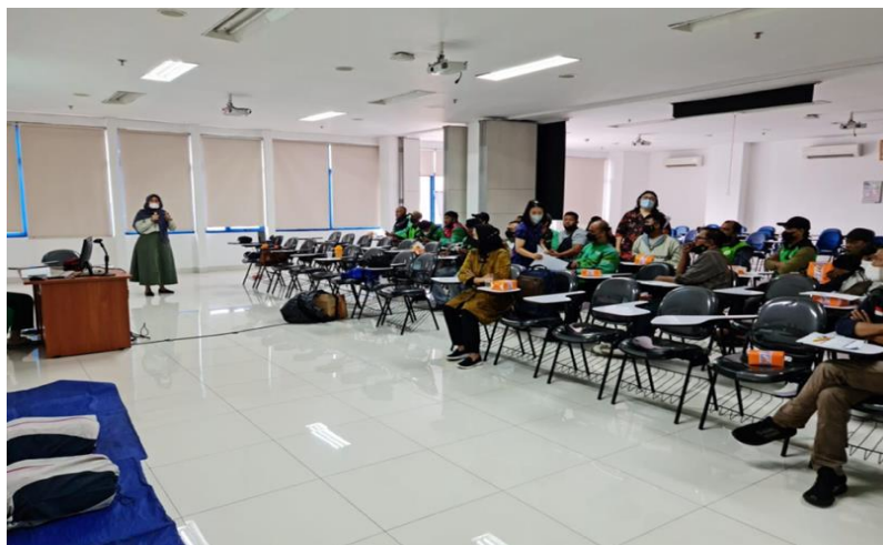
Gambar 3. Sesi Penyuluhan dan Diskusi