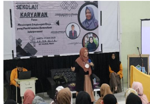
Gambar 6. Penyampaian Materi