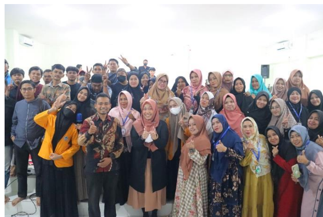
Gambar 9. Foto Bersama