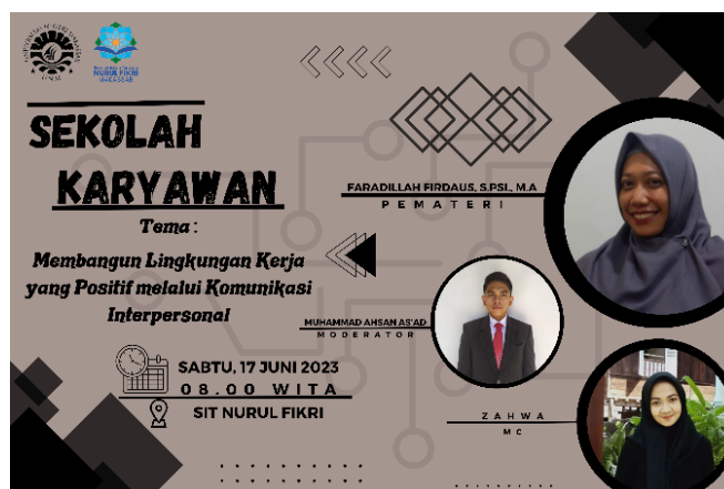
Gambar 4. Spanduk Kegiatan