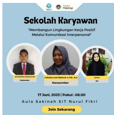
Gambar 3. Pamflet Kegiatan

Tahap pertama adalah merancang kegiatan psikoedukasi secara menyeluruh dengan mempertimbangkan kebutuhan karyawan sekolah. Tahapan merancang kegiatan seminar psikoedukasi dilakukan dengan menentukan tema serta topik psikoedukasi. Melakukan identifikasi tujuan utama dari kegiatan seminar psikoedukasi, kemudian mendiskusikan materi yang akan disampaikan kepada narasumber. Rancangan kegiatan seminar psikoedukasi juga termasuk merancang pamflet kegiatan, spanduk kegiatan, susunan acara, dan ice breaking . Berikut adalah rancangan pamflet serta spanduk kegiatan: