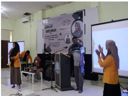
Gambar 7. Ice Breaking