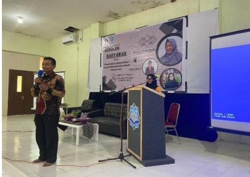
Gambar 5. Pembukaan

perwakilan pembimbing kegiatan BKP Magang Fakultas Psikologi Universitas Negeri Makassar. Berikut adalah dokumentasi kegiatan seminar psikoedukasi: