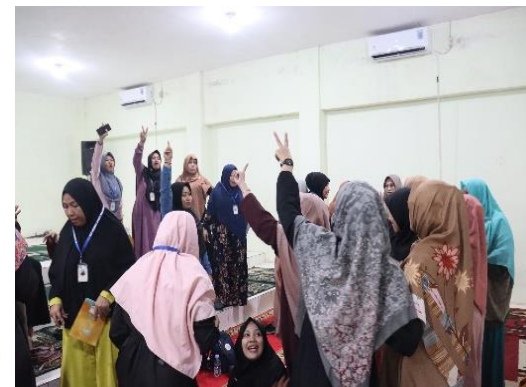
Gambar 8. Games