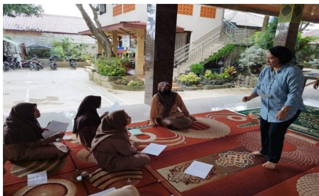
Gambar 3. Penyampaian Materi

Hasil post-test menunjukkan adanya peningkatan pemahaman dari para peserta terhadap soal 1, 4, dan 5 sebagaimana yang bisa dilihat pada gambar di atas. Untuk soal nomor 1 hanya ada 1 peserta yang masih salah dalam menjawab. Sementara soal nomor 4 mengalami peningkatan dari awalnya hanya 13 peserta yang menjawab benar menjadi 18. Adapun soal nomor 5, sebanyak 14 peserta mampu menjawab dengan benar. Dari hasil post-test dapat disimpulkan bahwa mayoritas peserta telah mengetahui hak-hak anak yang melekat pada diri mereka dan bagaimana kaitannya dengan pelaksanaan SDGs yang dicanangkan selesai pada tahun 2030.