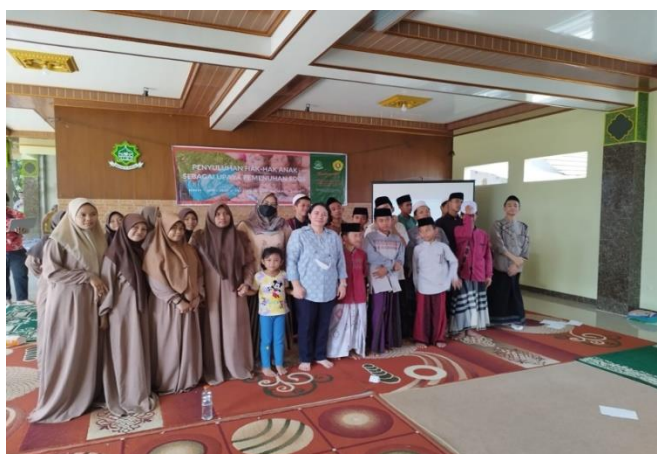
Gambar 4. Foto Bersama Peserta