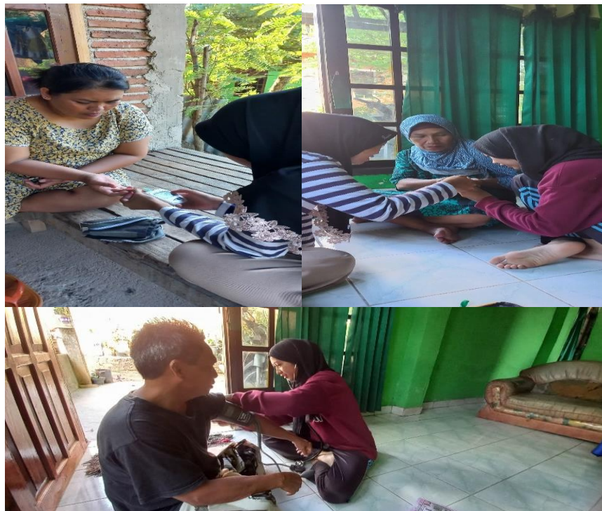
Gambar 1. Pemeriksaan tensi

Berdasarkan hasil kegiatan pemeriksaan yang telah dilakukan didapatkan sebanyak 5 warga prehipertensi, 4 warga hasil gula darah acak > 200mg/dl, 2 warga asam urat dan tidak ada warga dengan kadar kolesterol lebih. Selain itu juga, pengetahuan warga bertambah dengan adanya pemberian informasi mengenai hipertensi, asam urat, kolesterol dan asam urat. Nilai normal untuk kadar gula puasa adalah < 126mg/dl, sedangkan untuk kadar gula darah sewaktu adalah < 200mg/dl. Pada pemeriksaan asam urat, nilai normal yang diambil untuk laki-laki adalah 3,4- 7,0ml/dl dan untuk Wanita adalah 2,4-6,0mg/dl. Untuk hipertensi dikategorikan menjadi 4 yaitu 1) Normal; sistolik (mmHg) < 120 dan diastolik (mmHg) < 80, 2) Prehipertensi, , sistolik (mmHg) 120-139 dan diastolik (mmHg) 80-89, 3) Hipertensi Derajat 1; sistolik (mmHg) 140-159 dan diastolik (mmHg) 90-99, 4) Hipertensi Derajat 2; sistolik (mmHg) ≥ 160 dan diastolik (mmHg) ≥ 100.