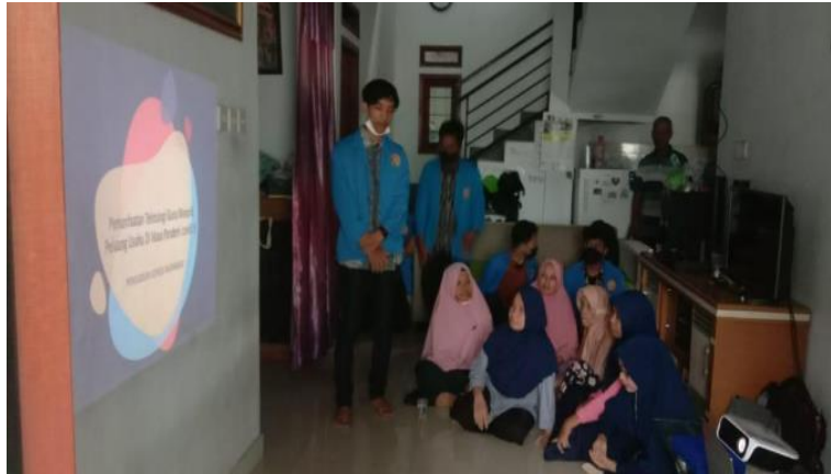
Gambar 1. Pembukaan Acara

Pada bagian ini berisi hasil dari kegiatan PKM yang sudah dilaksanakan, sisipkan foto kegiatan minimal 3 dengan keterangannya