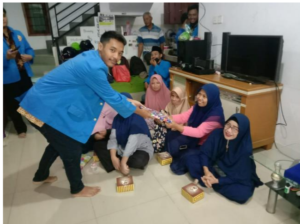
Gambar 7. Penyerahan Hadiah kepada Masyarakat Jombang