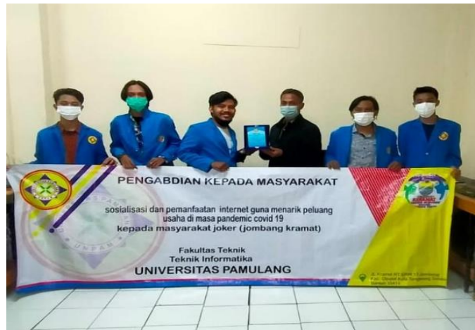
Gambar 9. Penyerahan Plakat Kepada Dospem