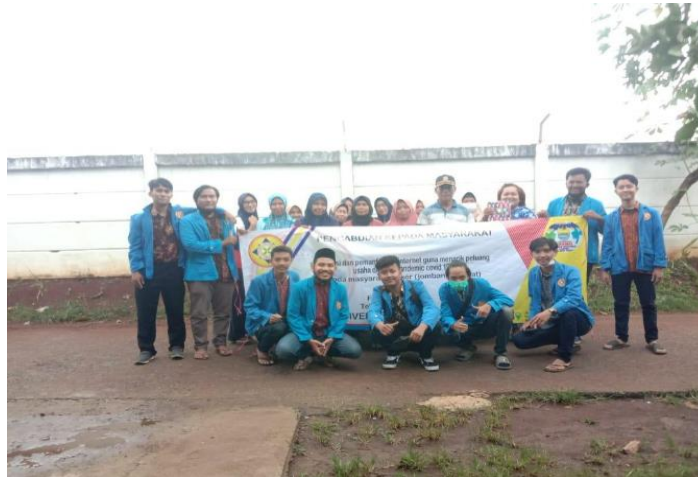
Gambar 10. Foto Bersama Warga Jember Kramat