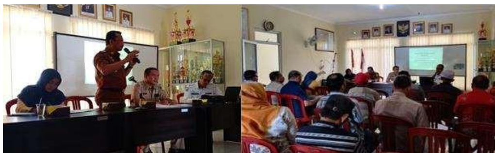
Gambar 2. Penyuluhan Risiko BABS Terhadap Kesehatan dan Pembuatan Jamban Sehat

Menurut Lawrence Green, terdapat tiga faktor utama dalam perilaku kesehatan, yaitu faktor predisposisi (seperti umur, pendidikan, pengetahuan, pekerjaan, agama, budaya); faktor pemungkin (seperti fasilitas kesehatan, ketersediaan lahan, media informasi); dan faktor penguat (seperti dukungan pemerintah, tokoh agama, dan tokoh masyarakat) (Martini, 2019; Pudjaningrum, Wahyuningsih, & Darundiati, 2016). Pada kegiatan pengabdian ini, ketiga faktor telah diikutkan dalam proses perubahan perilaku BABS. Penyuluhan sebagai intervensi pada faktor pertama; teknologi pada faktor kedua; serta dukungan pemerintah dan tokoh masyarakat pada faktor ketiga, Pembagian peran merupakan langkah strategis dalam aplikasi konsep perubahan perilaku.