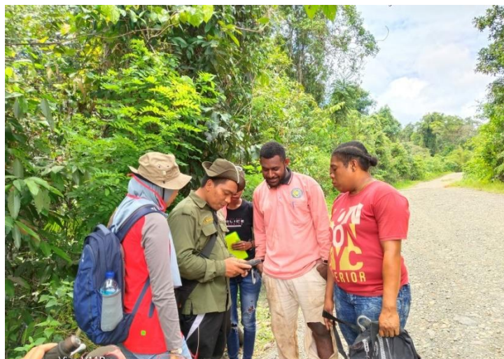
Gambar 3. Peserta Memperhatikan Penjelasan Fitur-Fitur GPS

Materi mengenai penggunaan GPS meliputi prinsip kerja GPS pada saat mengambil data di lapangan, cara setting GPS sebelum digunakan di lapangan, cara kalibrasi kompas, cara pengambilan titik koordinat ( waypoint ) dan cara pengambilan data track . Adapun untuk materi Avenza Maps meliputi instalasi aplikasi, cara menambahkan peta kerja, bernavigasi ke tujuan, mencari koordinat dan merekam jalur ( tracking ). Para peserta sangat antusias mendengarkan penjelasan seperti yang terlihat pada Gambar 3.