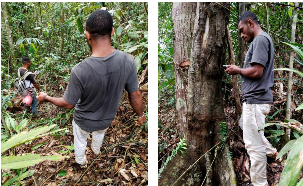
Gambar 6. Praktik Pengambilan Data Koordinat Menggunakan Avenza Maps dan GPS