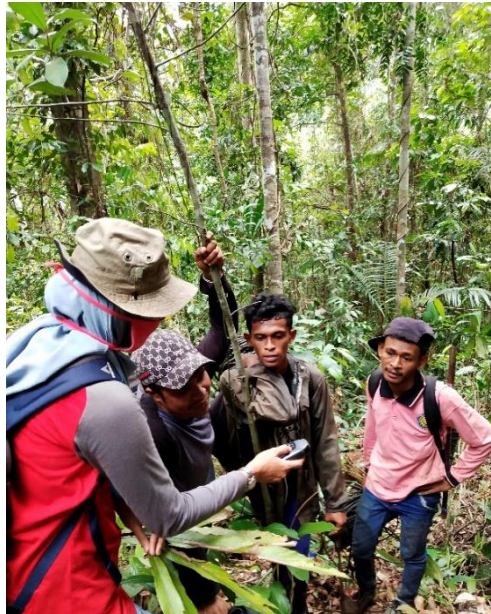
Gambar 5. Penjelasan Pengambilan Data Koordinat Menggunakan GPS