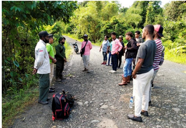
Gambar 2. Pembekalan Materi tentang GPS dan Avenza Maps

Global Positioning System (GPS) dan Avenza Maps merupakan aplikasi yang memudahkan pengambilan data di lapangan. Fitur-fiturnya yang cukup lengkap dapat dipilih dan disesuaikan dengan kebutuhan data yang diperlukan oleh pengguna. Hasil identifikasi tingkat pengetahuan peserta dilihat dari kuesioner yang dibagikan dimana sebagian besar dari mereka belum memahami dengan baik cara penggunaan GPS. Bahkan ada beberapa peserta yang belum pernah mendengar tentang aplikasi Avenza Maps. Oleh karena itu, sebelum peserta melakukan praktek langsung menggunakan GPS dan Avenza Maps maka perlu adanya pemberian materi seperti yang disajikan pada Gambar 2.