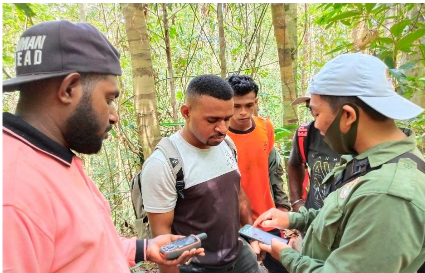
Gambar 4. Penjelasan Pengambilan Data Koordinat Menggunakan Avenza Maps

Beberapa koordinat pohon yang diambil di lapangan mengalami pergeseran. Setelah dilakukan cek ternyata dipengaruhi oleh kondisi lingkungan sekitar hutan yang masih sangat rapat tutupan vegetasinya. Hal ini menyebabkan jumlah penerimaan satelitnya berkurang sehingga koordinat yang diambil cenderung bergeser dari posisi yang sebenarnya. Demikian halnya dengan penggunaan Avenza Maps. Aplikasi ini bagus untuk daerah yang terbuka sehingga ketika dipergunakan untuk penentuan koordinat di hutan yang cukup rapat, maka tingkat keakuratannya berkurang karena tergantung dari penerimaan satelit dari Handphone. Gambar 4 dan Gambar 5 merupakan penjelasan prosedur pengambilan titik koordinat di lapangan menggunakan GPS dan Avenza Maps. Sedangkan Gambar 6 peserta melakukan praktik langsung pengambilan data koordinat pohon di hutan.