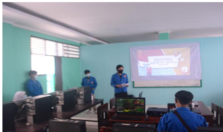
Gambar 2. Pengenalan Microsoft Office