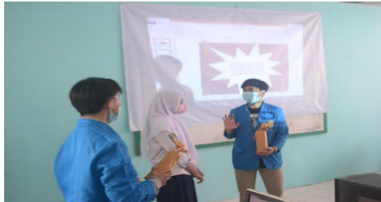
Gambar 4. Sesi Tanya Jawab