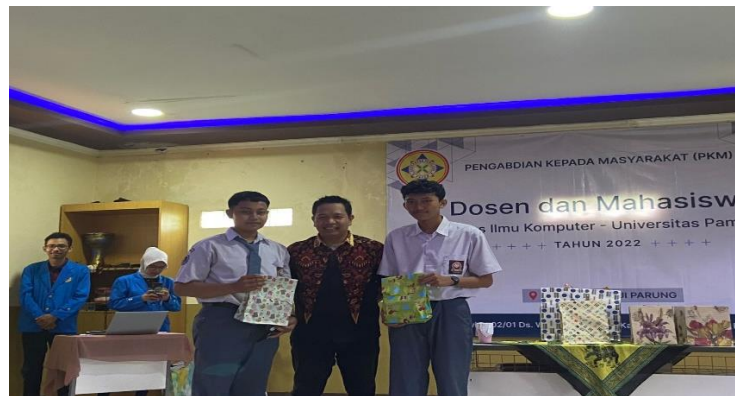
Gambar 5. Pemberian Hadiah