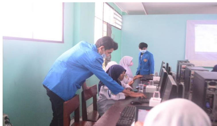
Gambar 3. Melakukan praktik di laboratorium