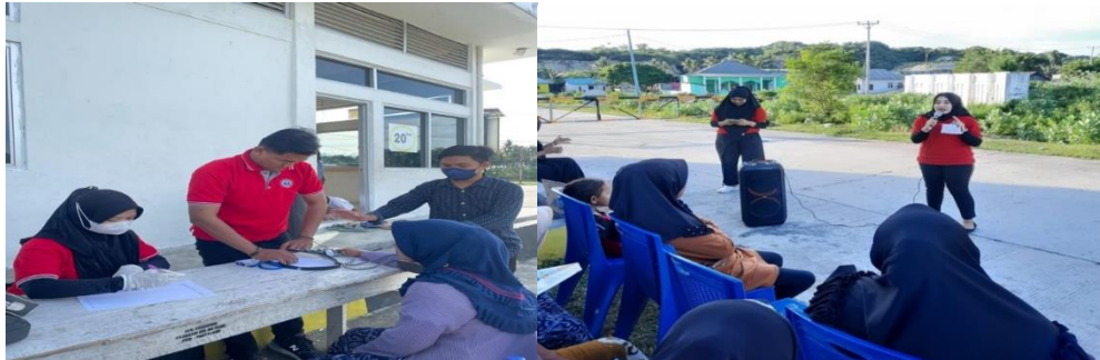
Gambar 2. Proses pengukuran tekanan darah dan proses penyuluhan

Adapun penanganan yang telah dilakukan memberikan edukasi tentang penatalaksanaan penyakit hipertensi dan senam lansia