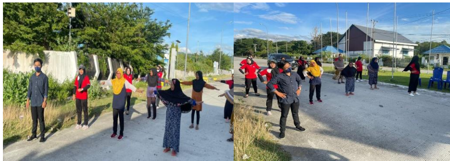
Gambar 3. Pelaksanaan Kegiatan Senam Lansia

Pelaksanaan pengkajian dan analisis pada masyarakat terkait penanganan upaya peningkatan pengetahuan masyarakat tentang pencegahan hipertensi dengan senam lansia di desa mangu rw 06/rt 11 pada tanggal 19 Desember 2022 sampai dengan selesai. Hasil dari kegiatan tersebut terlaksana dengan baik dan didapatkan masyarakat dapat berperan aktif dalam pelaksanaan kegiatan penyuluhan dan senam lansia. Evaluasi lainnya di diharapkan oleh masyarakat dan kader menjadwalkan kegiatan senam lansia ini untuk penangan pencegahan hipertensi, melalui penyuluhan kesehatan tentang pencegahan dan pengendalian hipertensi yang dilakukan secara rutin kepada lansia dapat meningkatkan pengetahuan lansia dalam mengatasi hipertensi yang diderita lansia.