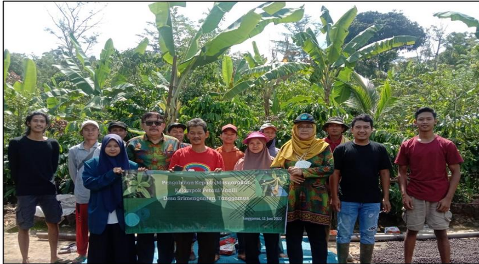
Gambar 4. Foto bersama dengan sebagian peserta pengabdian di kebun vanili Desa Srimenganten, Tanggamus, Lampung