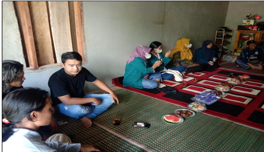
Gambar 2. Suasana diskusi antara narasumber dengan para petani vanili Desa Srimenganten Tanggamus Lampung