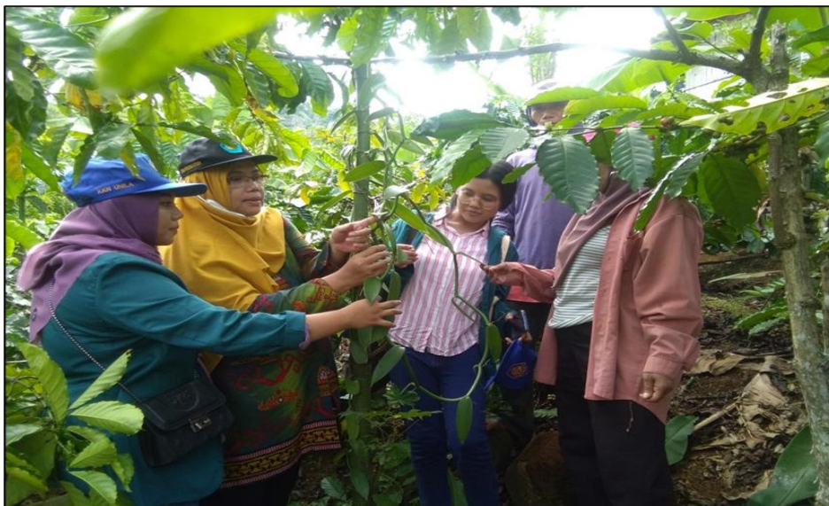
Gambar 3. Diskusi tentang penyakit vanili yang menyerang tanaman vanili di kebun milik petani

Kunjungan ke lokasi perkebunan vanili salah satu peserta pengabdian ini dilakukan setelah selesai acara sosialisasi penyuluhan kepada para petani. Kunjungan ke lokasi perkebunan vanili ini dilakukan dengan tujuan meninjau langsung kondisi perkebunan vanili dan berdiskusi dari hasil penyuluhan guna memahami pengetahuan petani vanili terkait materi yang telah disampaikan ketika penyuluhan. Dokumentasi kunjungan ke lokasi perkebunan vanili salah satu peserta di Desa Srimenganten, Kecamatan Pulau Panggung, Tanggamus disajikan pada Gambar 3 dan Gambar 4.