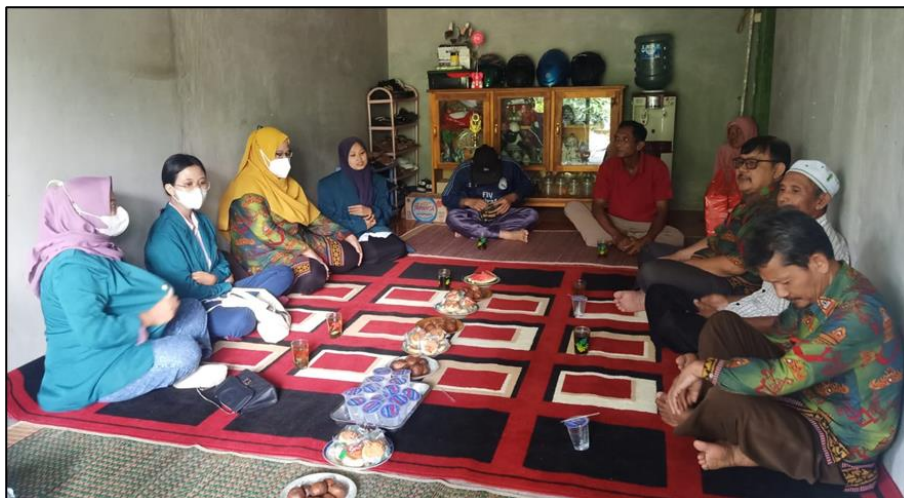
Gambar 1. Narasumber sedang menyampaikan materi penyuluhan kepada para petani vanili di Desa Srimenganten Tanggamus Lampung

Peserta yang hadir dan suasana sosialisasi dan penyuluhan disajikan pada Gambar 1 dan Gambar 2 dibawah ini.