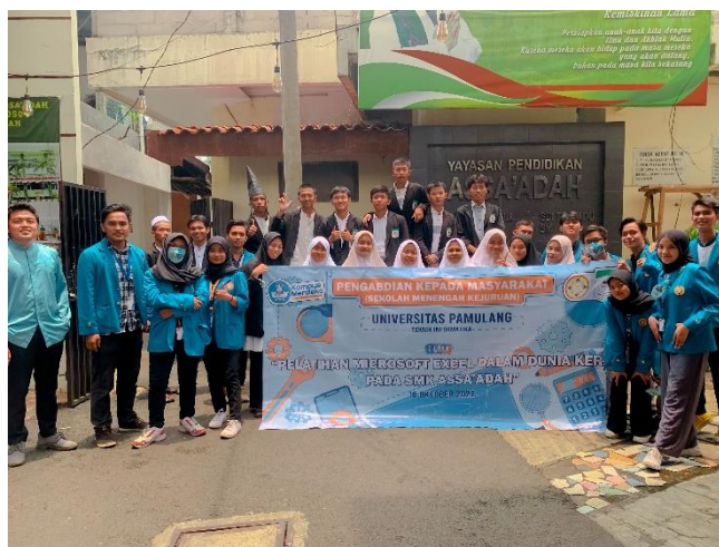
Gambar 12. Sesi Foto Bersama Peserta PkM dengan Siswa/I SMK Assa'adah

Di penghujung acara dilakukan penutupan kegiatan dan sesi foto bersama antara pihak SMK Assa'adah dan Universitas Pamulang sebagai kenang – kenangan dalam kegiatan PKM (Pengabdian Kepada Masyarakat) dengan tema Pelatihan Microsoft Excel Dalam Dunia Kerja Pada SMK Assa'adah.