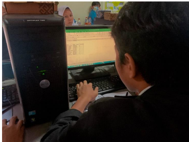
Gambar 8. Praktik siswa/i SMK Assa'adah