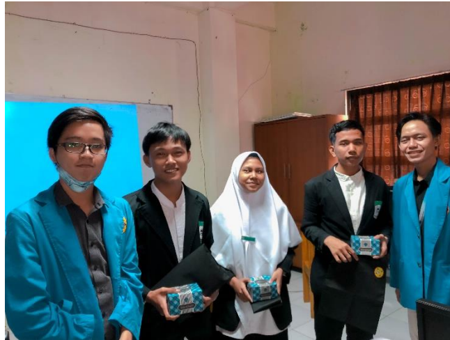
Gambar 10. Pemberian Hadiah Sesi Tanya Jawab

Setelah kegiatan praktik selesai dilakukan, kegiatan dilanjutkan dengan sesi tanya jawab yang disertai juga oleh pemberian hadiah sebagai apresiasi terhadap Siswa/i SMK Assa'adah yang beruntung dalam menjawab setiap pertanyaan yang diberikan oleh pemateri.