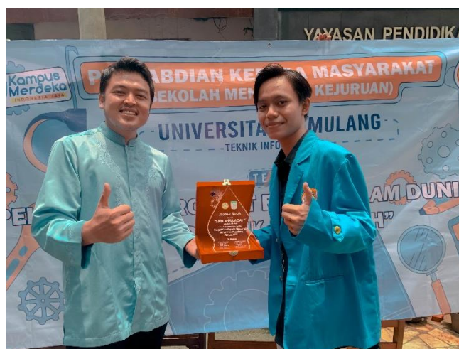
Gambar 11. Pemberian Cenderamata berupa Plakat dari Peserta PkM kepada SMK Assa'adah

Setelah kegiatan tanya jawab selesai, kegiatan dilanjutkan dengan pemberian cinderamata berupa plakat yang diwakili oleh Ketua Pelaksana dan guru pembimbing SMK Assa'adah sebagai perwakilan penerimaan plakat PKM kepada SMK Assa'adah selaku Patner Kerjasama Universitas Pamulang dengan SMK Assa'adah serta sebagai tanda Terima kasih kepada SMK Assa'adah dalam kegiatan PKM (Pengabdian Kepada Masyarakat).