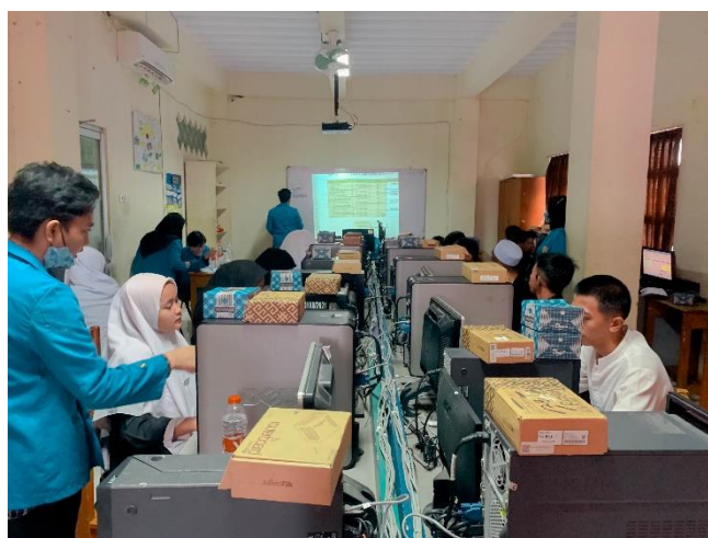
Gambar 9. Suasana Lab Komputer pada SMK Assa'adah