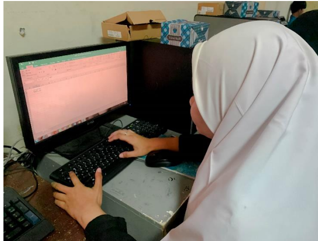
Gambar 7. Praktik siswa/i SMK Assa'adah