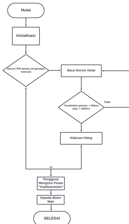
Gambar 3. Flowchart Sistem

Flowchart merupakan suatu bagan yang menunjukkan alur program atau prosedur sistem secara logika (Budiman et al., 2021). Terutama saat membuat program menggunakan arduino IDE. Flowchart dari sistem penelitian yaitu dengan memulai, selanjutnya dilakukan inialisasi pada sensor pir, sensor getar, relay, dan Esp8266 dalam keadaan normal, saat terdeteksi pergerakan sensor PIR aktif untuk mendeteksi pergerakan manusia melalui pancaran sinar inframerah, kemudian Sensor Getar juga aktif saat terdeteksi getaran pada pusat sensor, pemilihan kondisi, jika kondisi yang diterima pada sistem sesuai maka proses data akan dilanjutkan ke tahapan perintah selanjutnya. Jika tidak proses berakhir. Relay 1 = Hidup, membunyikan klakson disetiap getaran yang diterima. Relay 2,3 = Mati, belum adanya perintah, cek notifikasi telegram, pengguna mengirim perintah “/matikanmotor” dan relay 2 = aktif, pengapian sepeda motor terputus melalui koneksi internet yang terhubung secara wirelles. Untuk lebih jelasnya akan ditunjukkan pada flowchart sistem berikut :