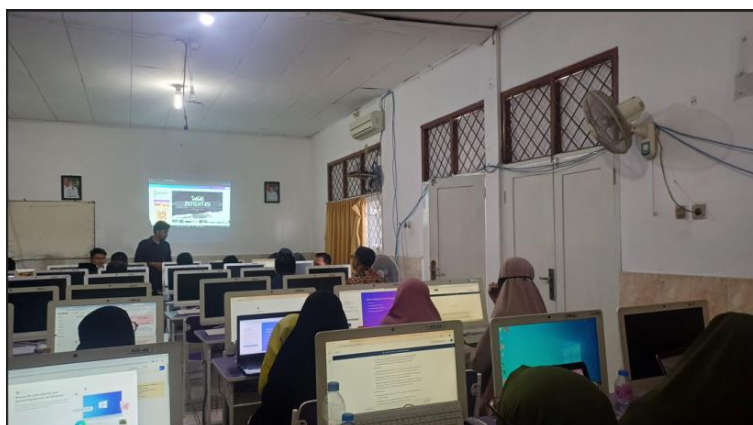
Gambar 4. Para Peserta Guru-Guru