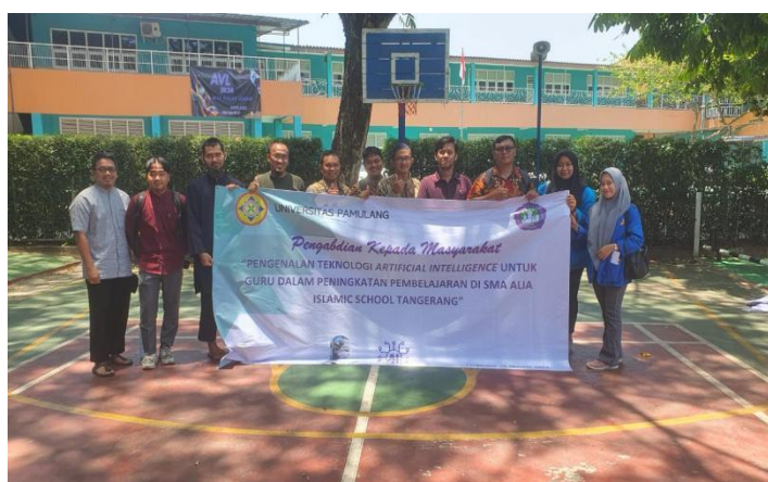
Gambar 5. Foto Bersama

Selanjutnya, kami membahas untuk produk-produk pada Artificial Intelligence (AI) didunia pendidikan. Kami menunjukkan bagaimana berkembangnya Artificial Intelligence (AI) dapat menciptakan lingkungan internet yang cerdas, terdesentralisasi, aman, dan responsif. Guru-guru juga kami berikan pemahaman dan pengetahuan tentang penerapan Artificial Intelligence (AI) di berbagai sektor seperti pendidikan, bisnis, kesehatan, dan pemerintahan.