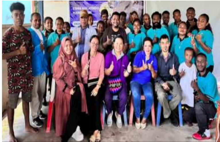
Gambar 2. Foto Bersama

Dokumentasi kegiatan PKM dosen STMIK Kreatindo Manokwari bersama masyarakat kampung Breml-Distrik Manokwari Utara adalah sebagai berikut: