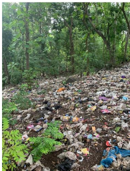
Gambar 2. Sampah di Lokasi Kegiatan

Desa Batuputik, Kecamatan Keruak adalah salah satu dari 239 desa di kabupaten Lombok Timur dengan penduduk 5.474 jiwa atau 1.817 keluarga yang menempati wilayah seluas 5.442 m 2 . Peruntukan atau karakteristik wilayah adalah daerah agraris, namun memiliki jarak dekat dengan pantai sehingga memiliki karakteristik bencana alam serupa dengan bencana alam pada daerah pesisir. Selain bencana alam daerah pesisir, seperti telah disebutkan sebelumnya, Desa Batu Putik memiliki bencana rutin berupa banjir pada musim hujan, akibat tidak tertanganinya masalah sampah dengan baik. Identifikasi awal dari permasalahan ini terbukti dengan adanya timbunan sampah di areal sungai dan sisa pembakaran sampah di sekitar sungai (gambar 2).