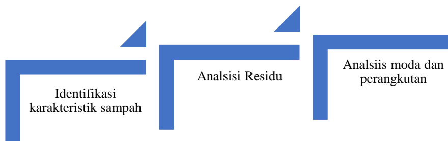
Gambar 3. Alur Kegiatan

Alur penelitian yang digunakan adalah alur tangga sebagai mana gambar 3